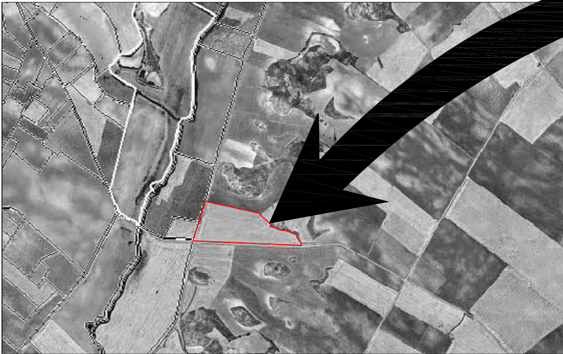
PARCELA DE SITUACION DE LA EDAR ESCALA = S/E