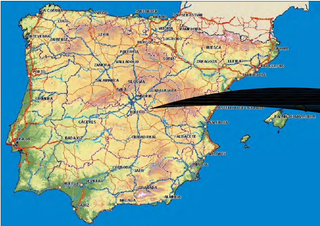
MAPA DE ESPAÑA ESCALA = S/E